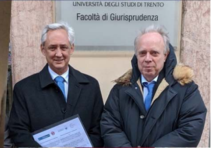
UNIVERSITÀ DEGLI STUDI DI TRENTO Facoltà di Giurisprudenza