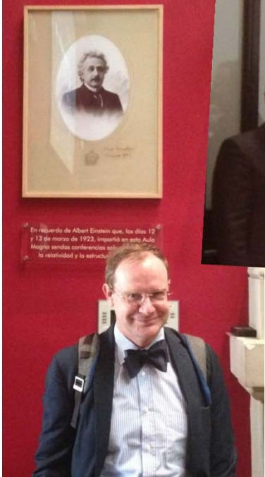
En recuerdo de Albert Einstein que, los días 12 y 13 de marzo de 1923, impartió en esta Aula Magna sendas conferencias sobre la relatividad y la estructura.